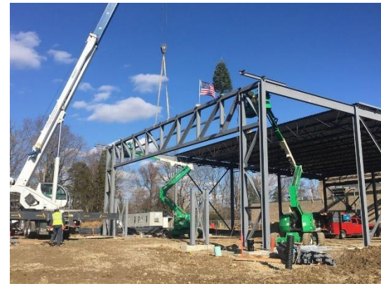
表演艺术中心 外部

正在进行的部分还包括训练室，乐队及合唱团室，以及宽阔的休息场所。当这三大部分完成，将最终建成整体 18000 平方英尺共计投入 900 万美元的大礼堂。