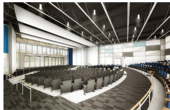
表演艺术中心 内部